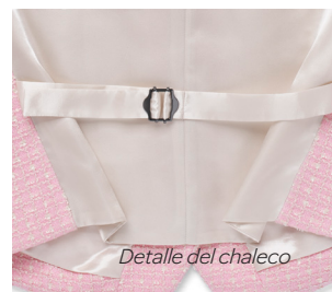
Detalle del chaleco