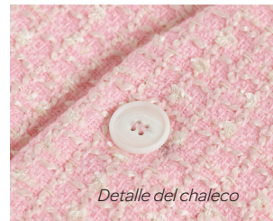
Detalle del chaleco