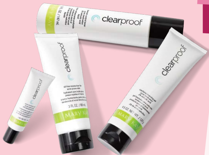
SOLUCIONES PARA EL ACNÉ