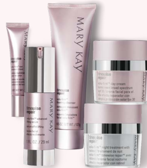
SOLUCIONES PARA LAS SEÑALES DE ENVEJECIMIENTO AVANZADAS