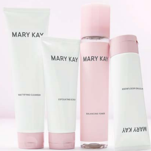
SOLUCIONES SENCILLAS DEL CUIDADO DE LA PIEL